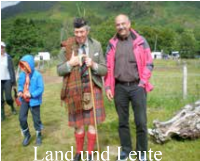
Land und Leute