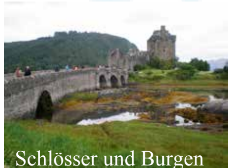
Schlösser und Burgen